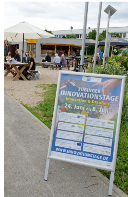
Innovationstag im Technologiepark Tübingen-Reutlingen.