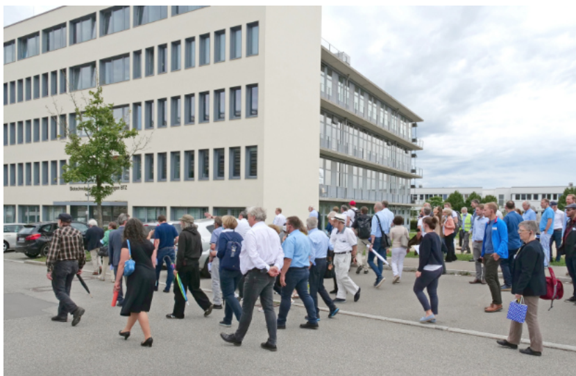
Sehr gut besucht waren auch die Spaziergänge im Rahmen der Innovationstage Tübingen. Oben: Spaziergang über das Tübinger Gelände des Technologieparks Tübingen-Reutlingen; unten: Spaziergang über das Gelände des Universitätsklinikums Tübingen.