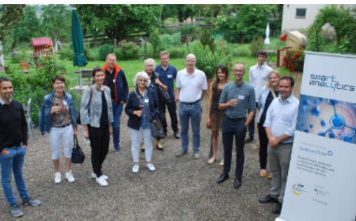
Die Smart Analytics Partner*innen im Hofgut Rosenau.

● Das Interreg-Projekt Codex4SMEs (Companion Diagnostics expedited for small and medium-sized enterprises) geht in die Verlängerung: Die EU fördert das erfolgreiche Projekt nun weiter bis Ende 2023. Mittlerweile sind 260 Unternehmen bei Codex4SMEs involviert. Das Netzwerk strebt durch die zunehmende Einführung von Personalisierter Medizin eine bessere Gesundheitsversorgung in Nord-West-Europa und darüber hinaus an. Für den optimalen Einsatz von Personalisierter Medizin ist eine Begleitdiagnostik unerlässlich. Ziel von Codex4SMEs ist es, die Entwicklung von Begleit-Diagnostika entlang der gesamten Wertschöpfungskette von kleinen und mittelständischen Unternehmen zu beschleunigen.